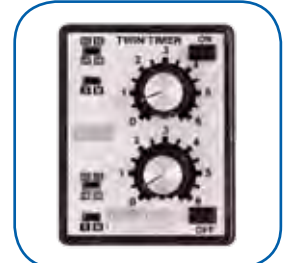
Programador analógico, fácil programación