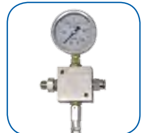
Distribuidor con manómetro y válvula de seguridad