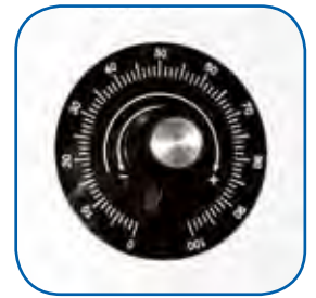
Variador de presión