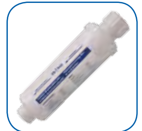
Filtro de partículas para la entrada del agua