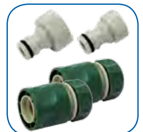
Conexiones para la manguera de aspiración